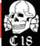
12. Combat 18