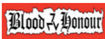
11. Blood and Honour