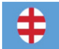
17. Hlinková garda (HG)